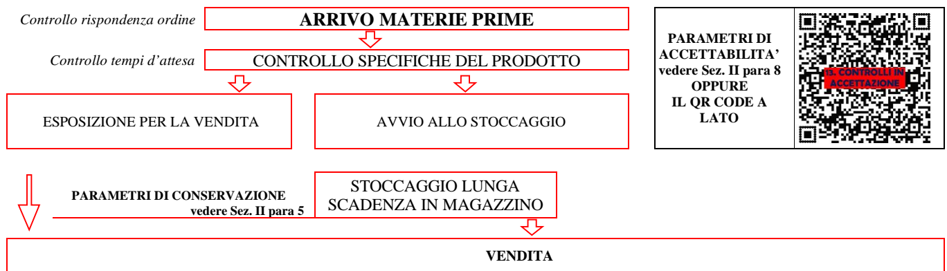
DIAGRAMMA DI FLUSSO GENERALE ACCETTAZIONE DELLA MATERIA PRIMA – CONTROLLO DELLE MERCI (vedere Sez. II para 8)